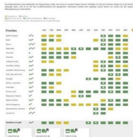
Abb. 3: Ausschnitt aus dem Tool „Regionalisierter Saisonkalender“.

Für die Testwochen wurden mithilfe der strategischen Menüentwicklung unter Berücksichtigung qualitativer Kriterien fünf Aktionsgerichte konzipiert. Die Basis bildete eine offene Menüplanung, die im Rahmen der KEINREZEPT-Idee gemäß dem Motto „Konzepte statt Rezepte“ einen niedrighschwelligem Ansatz ermöglicht. Beispielhafte Aktionsgerichte waren „Unpellokartoffeln und Quark“, „Linsen-Pojarski“ und „Möhrenuntereinander“.