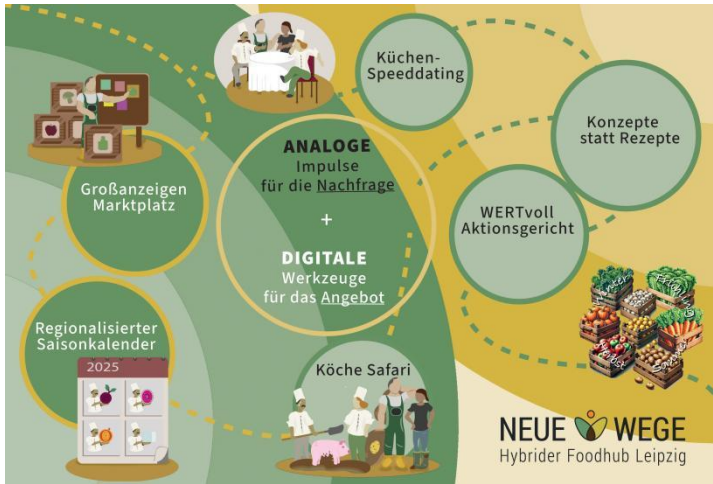
Abb. 1: Digitale Tools und analoge Impulse der Angebots- und Nachfrageseite des Hybriden Foodhubs Leipzig

fördern interdisziplinären Wissenstransfer und praxisnahen Austausch, während das „Küchen-Speeddating“ die Vernetzung zwischen Landwirtschaft, Bündelung und Gastronomie stärkt. Dieser Einbezug und Beteiligung der Praxisakteure auf kollegialer Arbeitsebene soll Bedarfe bei den Großküchen und Lieferanten aktivieren, interne Prozesse optimieren und externe Sogmechanismen bei den Gästezielgruppen der Kantinen anregen, um das Interesse nachhaltig zu steigern.